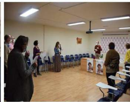
PLANTACIÓN DE PENSAMIENTOS

Este año, el tema es “ Jubileo por la Tierra ”. Nos invita a reflexionar sobre la relación integral entre el descanso para la Tierra y las formas de vida ecológicas, económicas, sociales y políticas. A lo largo del mes de celebración, los cristianos del mundo nos unimos para cuidar de nuestra casa común.