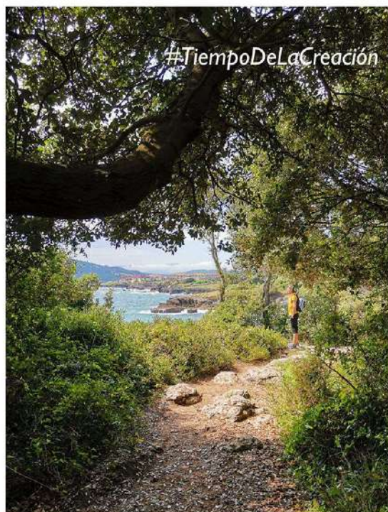
CONCURSO DE FOTOS

Los cristianos de todo el mundo han acogido este tiempo como parte de su calendario anual. El Papa Francisco hizo oficial la cálida bienvenida de la Iglesia Católica Romana al Tiempo de la Creación en 2015. Este periodo comienza el 1 de septiembre, con la Jornada Mundial de Oración por el Cuidado de la Creación, y termina el 4 de octubre, en la fiesta de San Francisco de Asís, el santo patrón de la ecología amado por muchas denominaciones cristianas.