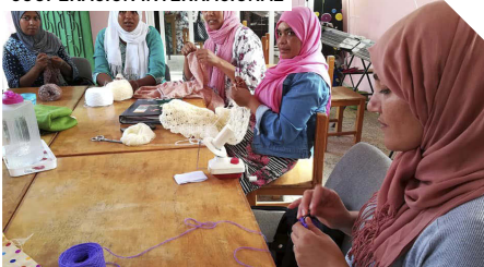
Visita al proyecto de desarrollo de la mujer "Asociación Lindalva" en el poblado de Ain Labid en Marruecos.