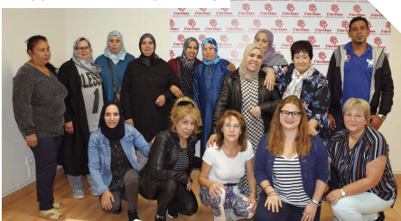
Participantes del Curso de "Lengua y cultura española"