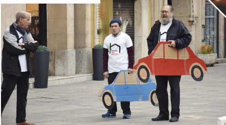
Día de las Personas Sin Hogar, obra de teatro al aire libre