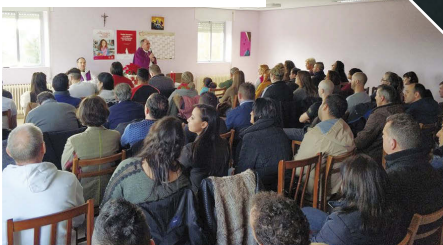
Eucaristía de Navidad en Proyecto Hombre, concelebrada por el Administrador Diocesano y el delegado-director de Cáritas