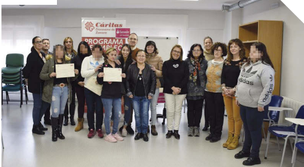
Clausura del Curso "Empleo Doméstico"