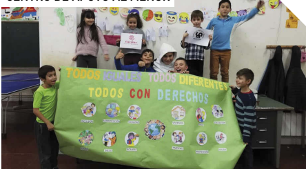
Celebración del Día Universal del Niño