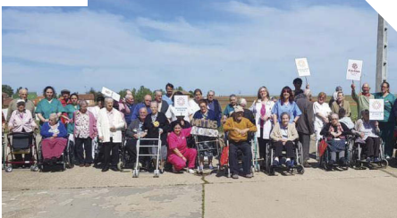
La residencia de Villarrín participa en la Marcha Solidaria Mundial