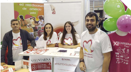
Feria de Bienvenida para nuevos alumnos de la USAL