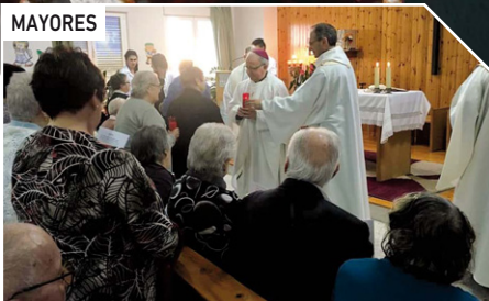
Eucaristía con motivo del Día de la Familia en nuestras residencias de Fermoselle