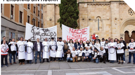
Día de las personas Sin Hogar