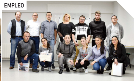
Clausura del Curso de Productos Frescos