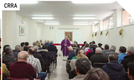
El Obispo visita el Centro de Alcohólicos