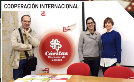
Día Mundial de la Alimentación