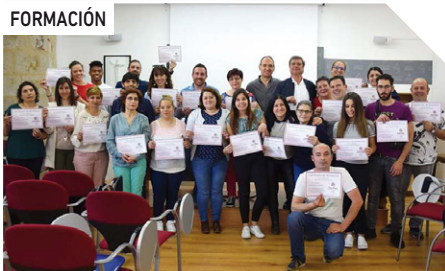
Clausura del Curso de Doctrina Social de la Iglesia