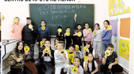
Día Universal del Niño