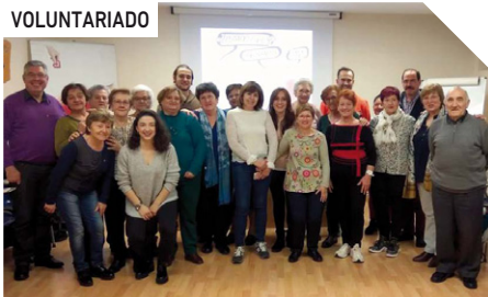
Formación básica de Voluntariado