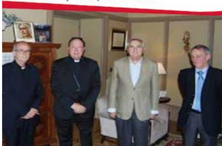
Presidente y Consejo de Dirección